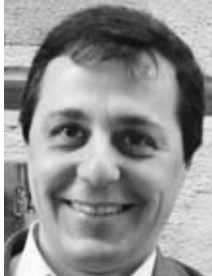
Dr. Ignazio Cassis Nationalrat und Präsident Public Health Schweiz

Widersprüche gehören zur unvollkommenen Natur des Menschen. Aber manchmal sind Widersprüche wirklich unerträglich, vor allem wenn sie, wie am 11. Juni im Nationalrat, explizit unter Politikern auftauchen. Zur Diskussion stand die parlamentarische Initiative Gutzwiller zum "Schutz der Bevölkerung und der Wirtschaft vor dem Passivrauchen". Damit hätten Nichtraucher vor den gesundheitsschädigenden und einschränkenden Wirkungen des Passivrauchens geschützt werden sollen. Der Ständerat hatte hierzu eine klare und kohärente Gesetzesvorlage vorbereitet. Ein ähnliches Gesetz, wie es in mehreren Kantonen schon existiert (Tessin, Genf, Solothurn ...).